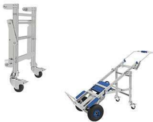
Supporto a terra