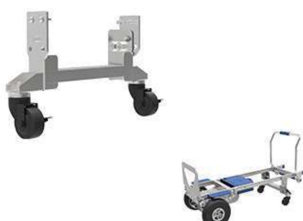
Ruote di supporto